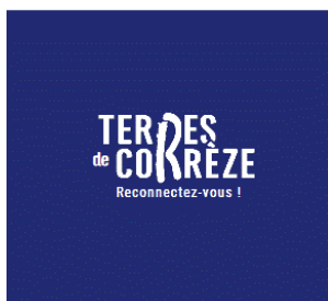
Fond couleur foncée