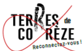
Changer la disposition, les placements