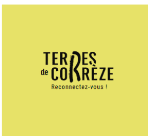
Fond couleur claire