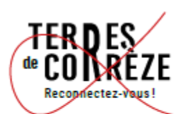
Changer la calligraphie du R par une police de caractère