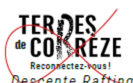
Ne pas respecter la marge de sécurité