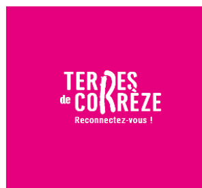
Fond couleur flashy