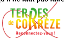
Appliquer d'autres couleurs, ou dégradés

Exemples de ce qu'il ne faut pas faire :