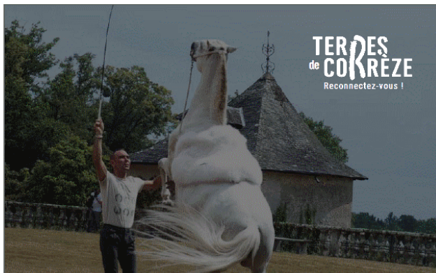
Fond photo + ajout d'un bloc noir avec une transparence de 50% => possibilité d'utiliser le logotype en blanc sans bloc de réserve